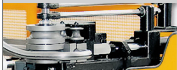
PROVAR 5 U-D