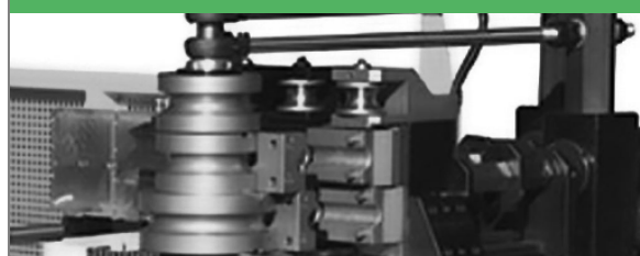
PROVAR 6 U-D