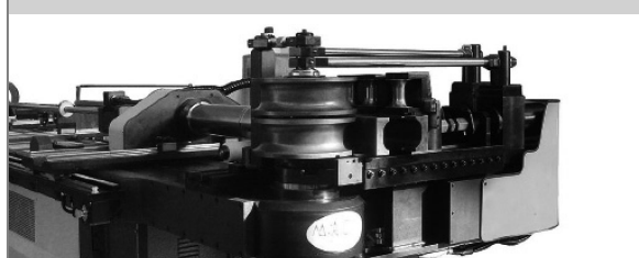
PROVAR 5 U-D